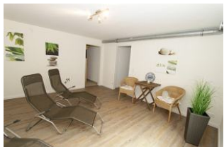
Der großzügige, sehr ansprechend gestaltete separate Ruheraum im Saunabereich im Keller des Hauses (für beide Wohnungen)