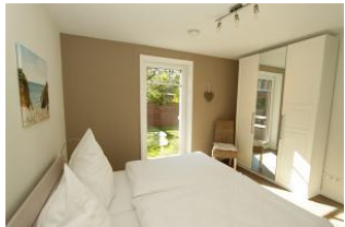
Sie haben sogar direkten Zugang "ins Grüne"