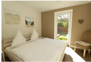
Hier nach ein schönen und erholsamen Urlaubstag einschlafen