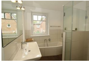
sogar mit kleiner Badewanne