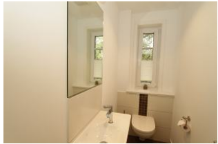
und ein zusätzliches Gäste-WC