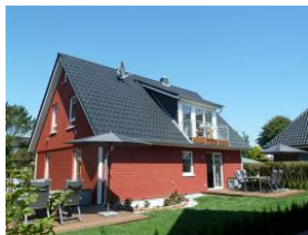
und noch eine weitere Ansicht ...