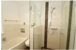
ein schickes Bad