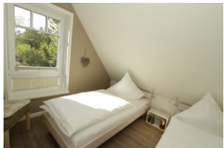
das zweite Schlafzimmer - für Kinder oder auch für Erwachsene