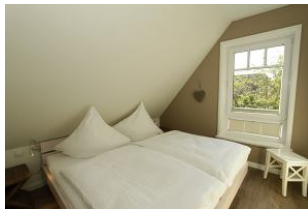
ein schickes Schlafzimmer mit Doppelbett