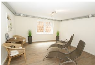
hier können Sie entspannen