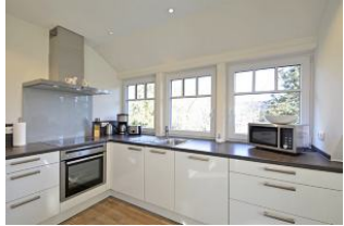
eine großzügige, vollständig ausgestattete Einbauküche