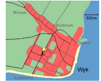
Entfernungen, zirka: zum Bäcker 70 m, zum Flugplatz 1,0 km, zum Golfplatz 1,0 km, zum Hafen 1,6 km, zum Meer 800 m, zum Badestrand 800 m