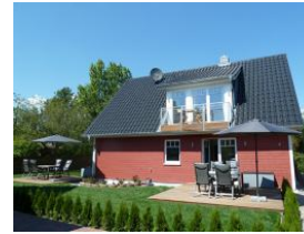
und noch die Ansicht von vorne ...