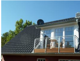
2 Personen können hier sitzen