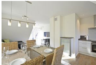
hier sitzen Sie in gemütlicher Runde zusammen