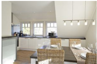
der einladende Eßbereich