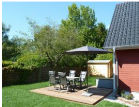
zusätzlich gibt es noch eine eigene Terrasse mit Gartenanteil