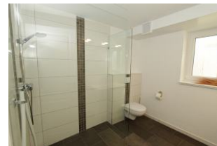
ein weiteres Badezimmer, welches zum Saunabereich gehört