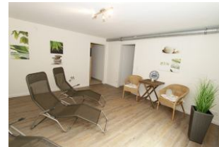
Der großzügige, sehr ansprechend gestaltete separate Ruheraum im Saunabereich im Keller des Hauses (für beide Wohnungen)