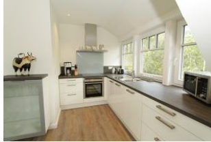
da macht Kochen Freude