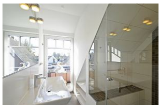
sogar mit kleiner Sitzbank in der Dusche