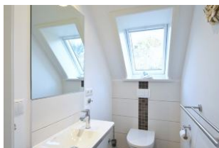
und ein separates WC