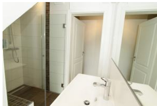
das sehr modern gestaltete Bad