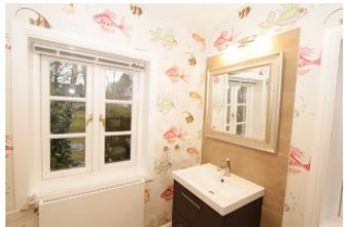
hier beginnen Sie gerne den Tag

Entfernungen, zirka: zum Bäcker 300 m, zur Einkaufsmöglichkeit 200 m, zum Flughafen 700 m, zum Golfplatz 800 m, zum Hafen 1,5 km, zum Meer 50 m, zum Badestrand 50 m, zum Ortszentrum 1,4 km