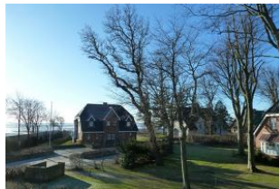
das Meer ...