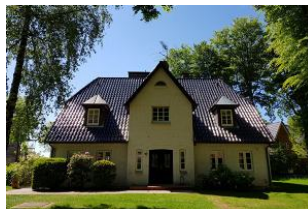
und von vorne