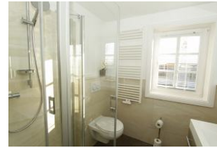
in harmonischen Farben gestaltet