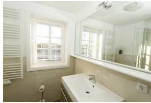
das 2. Duschbad im OG, ebenfalls absolut zeitgemäß