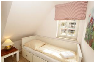
das Einzelzimmer - vor allem Kinder fühlen sich hier wohl (Maß: 80 x 200 cm)