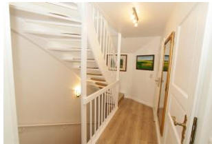
auch der Flur im OG ist sehr ansprechend gestaltet