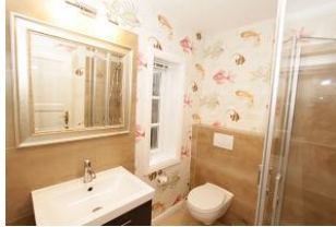
das moderne Bad im EG - ein echter "Hingucker"