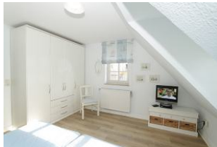
mit Fernseher und genügend Platz für Ihre Utensilien