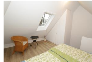
und wenn Sie aus diesem Fenster schauen, sehen Sie