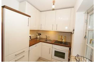
in der voll ausgestatteten Einbauküche bereiten Sie Ihre Mahlzeiten zu