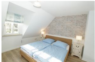
das helle, sonnige Schlafzimmer