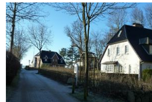
und am Ende des Weges ist schon der Strand ...