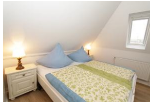
das 3. Schlafzimmer in der Galerie im Spitzboden