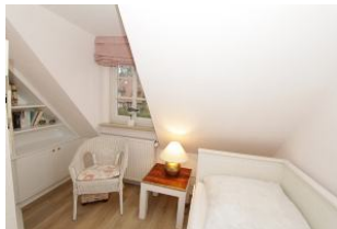
mit einer kleinen, gemütlichen Sitzecke