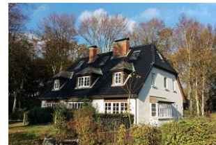
das Haus im Frühjahr ...