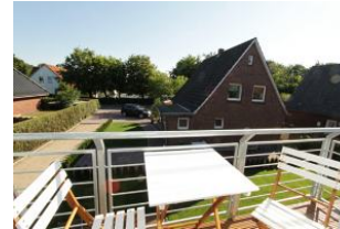
und die Sonne genießen ...