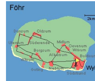
Entfernungen, zirka: zum Bäcker 70 m, zum Flugplatz 1,0 km, zum Golfplatz 1,0 km, zum Hafen 1,6 km, zum Meer 800 m, zum Badestrand 800 m